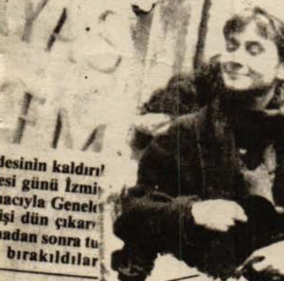
desinin kaldırı/esi günü İzmir/acıyla Genel işi dün çıkarı/adan sonra tu/bırakıldılar

za Yasası'nın 438. maddesi, tecavüz kadının fahişe olması durumunda cezasının 2/3 indirimini öngörü-10. maddesi ise yasa önün-iyor. Diyor ama Anayasa esi de "Yasa önünde eşit-den aynı kurallara bağli-emez. Kimi yurttaşların narak değişik kurallara tlik ilkesine aykırılık andıkları haklı bir ne-ak ve kamu yararının n sarkıntılık, ırza geç-nca savd... z bir