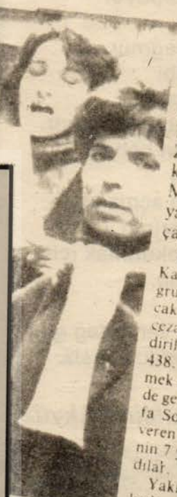
tu sırada cam- tür Evi'r

Biz kadınlar, 438. maddeye de, kadınlara yönelik tecavüzü teşvik eden diğer tüm maddelere de, kadın bedenini erkeklerin hizmetinde bir mal haline getiren ve bizzat devlet eliyle desteklenen fuhuşa karşı da, her yolla mücadele edeceğimizi bir kez daha vurguluyoruz.